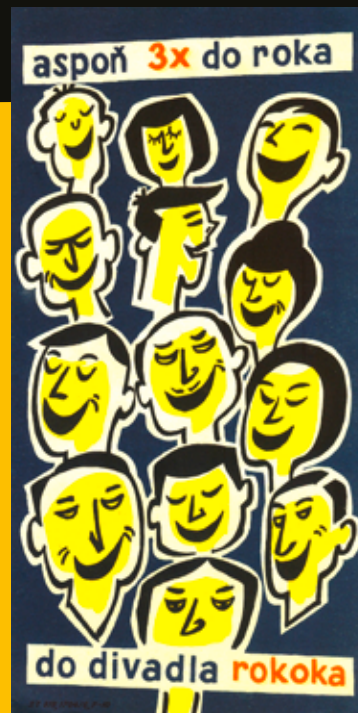
Reklama z programu divadla Rokoko