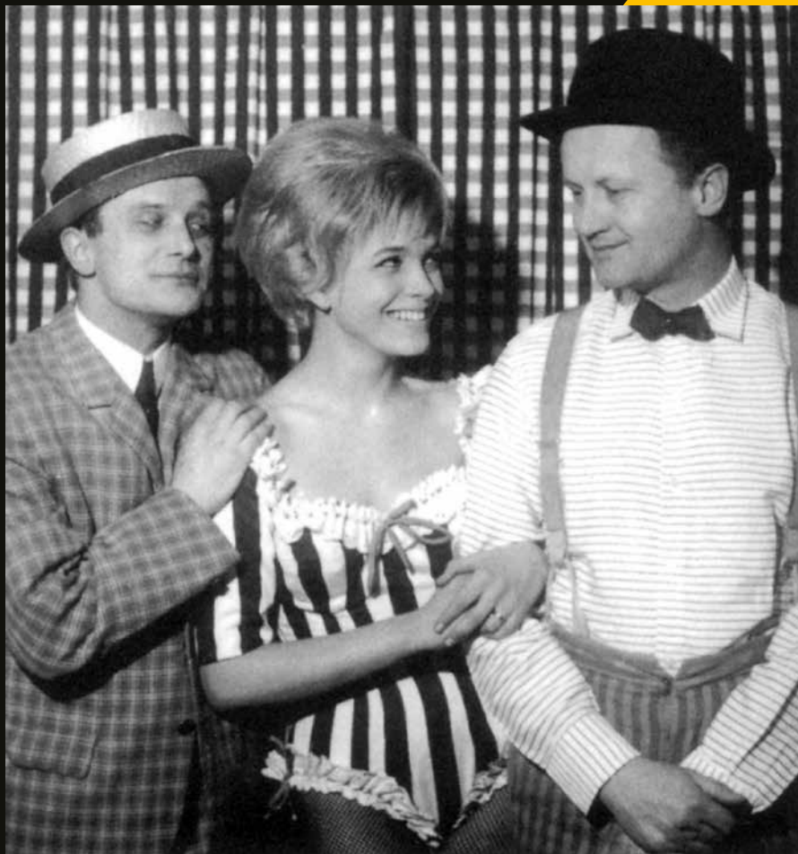
Semafor – Jonáš a tingltangl – J. Suchý, M. Zahrynowská a J. Šlitř

tisíc klarinetů a Faust, Markétka, služka a já našla uplatnění ve Fialkově pantomimě Devět klobouků na Prahu a nakonec se dočkala recitálu Nejlepší rocky paní Hermanové, který pro ni napsali pánové Havel a Miloš Macourek.